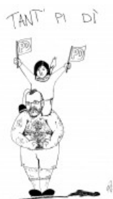
Tant' pi di